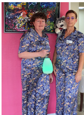
Tenue de travail du personnel du PASA de nuit de l'Œuvre hospitalière de Corbigny

Des réunions internes pluridisciplinaires sont régulièrement organisées, les échanges y sont nombreux. Une révision de la file active des résidents bénéficiaires, en